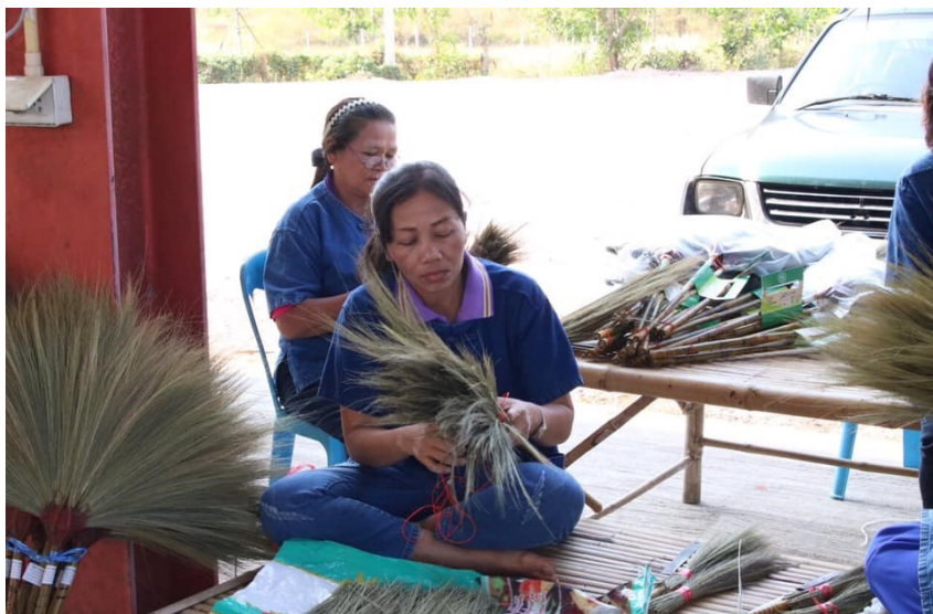
ผลิตภัณฑ์ไม้กวาด (มผช.๙/๒๕๔๖)