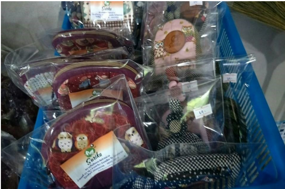
ผลิตภัณฑ์จากผ้า (พวงกุญแจ กระเป๋าต่างค์) (มผช.๔๑๗/๒๕๕๘)