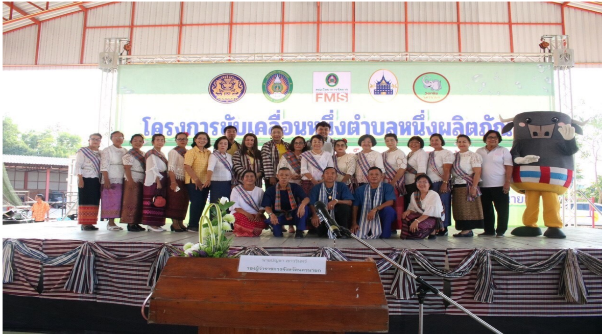
มหาวิทยาลัยโดยคณะวิทยาการจัดการ นำโดยสาขาการท่องเที่ยวฯ ได้ไปบริการวิชาการแก่ชุมชนในตำบล สาธิตา และจัดนำเสนอผลิตภัณฑ์ ณ อปต.สาธิตา อำเภอเมือง จังหวัดนครนายก