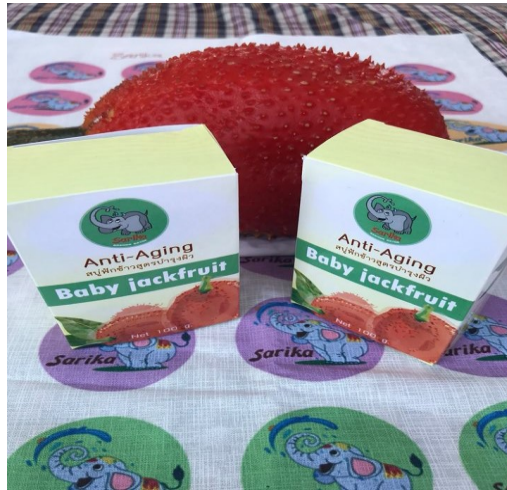
พัฒนาบรรจุภัณฑ์สำหรับผลิตภัณฑ์สปูก้อนกลีเซอรีนฟักข้าว