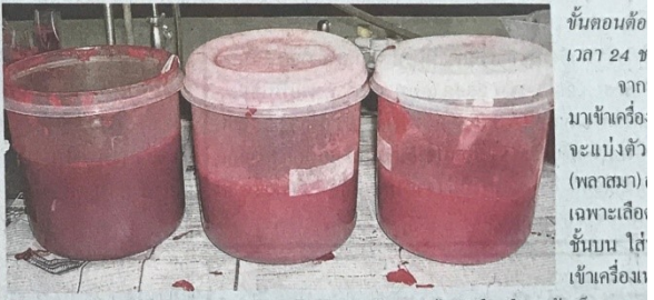
ขั้นตอนต่อ เวลา 24 ชั่วโมง จากมาเข้าเครื่องจะแบ่งตัว (พลาสมา) เฉพาะเลือดชั้นบน ใส่เข้าเครื่อง

ในการเป็นอาหารเสริมสู่การผลิตในเชิงพาณิชย์ ถ้าจัดไขมันในเลือดแล้วเก็บเฉพาะโดยสำนักงานพัฒนาการวิจัยการเกษตร (สวท.) ซึ่งเป็นส่วนโปรตีนที่ต้องการ นำมาสนับสนุนทุจริย