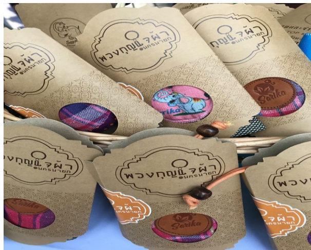
พัฒนาบรรจุภัณฑ์สำหรับผลิตภัณฑ์จากผ้า (พวงกุญแจ กระเป๋าสตางค์)