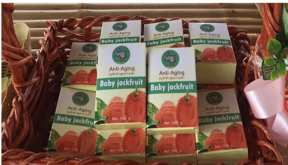
สบู่ก้อนกิโลเชอริ่นฟักข้าว (มผช.๖๖๕/๒๕๕๓)